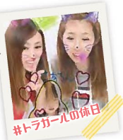
#トラックガールの休日