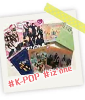
#K-POP #iz one