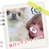
#ロングコートチワワ

車好きが高じて、憧れのダンプ乗りへ転身。たくさん現場経験を積んで、操作技術を磨いています