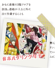
#ボルトリブが毎日