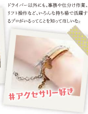
#アクセサリー好き

ドライバー以外にも、事務や仕分け作業、リフト操作など、いろんな持ち場で活躍するプロがいるってことを知ってRLした。