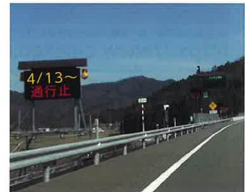
特設情報板による情報提供(イメージ)