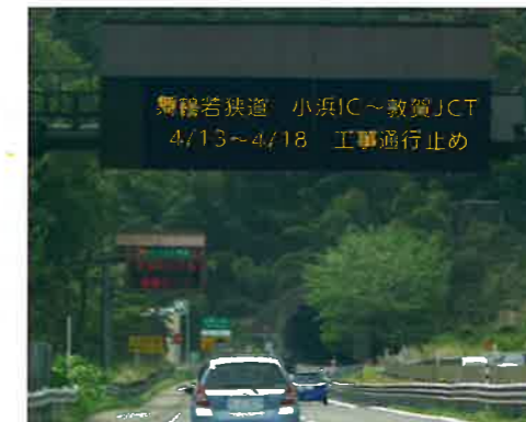
本線情報板による情報提供(イメージ)

通行止め実施中は、広域迂回ルートへの分岐部の手前で本線上の情報板や特設情報板による情報提供をおこないます。