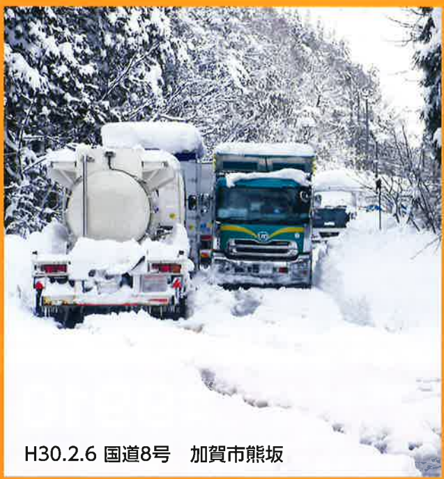
H30.2.6 国道8号 加賀市熊坂

罰金 5万円以下 反則金 7千円 (大型自動車等) 6千円 (普通自動車等) 石川県警察本部