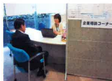
【企業相談コーナー】