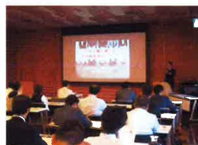
【採用力向上セミナー】