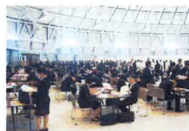
【ふるさと企業魅力発見フェア】