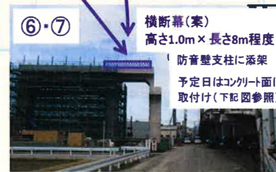
⑥・⑦横断幕デザイン

横断幕(案) 高さ1.0m×長さ8m程度 防音壁支柱に添架 予定日はコンクリート面に 取付け(下記図参照)