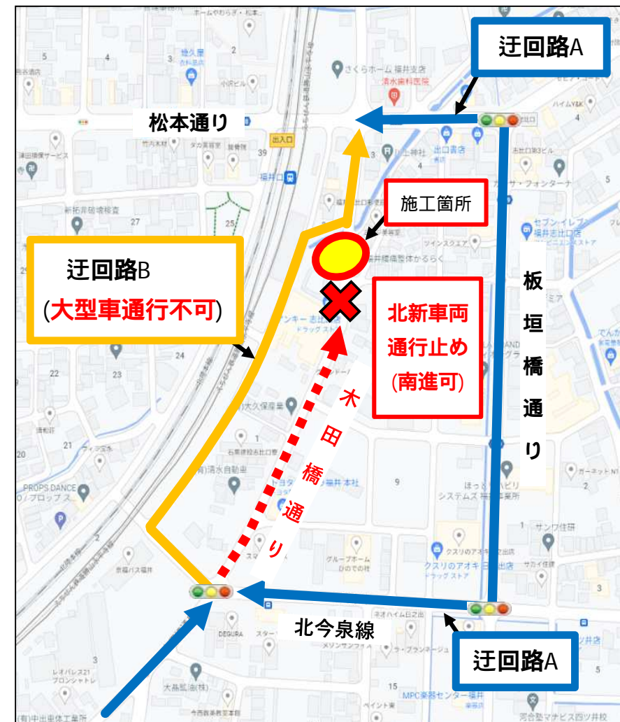
迂回路詳細(現場周辺)