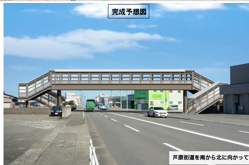
芦原街道を南から北に向かって