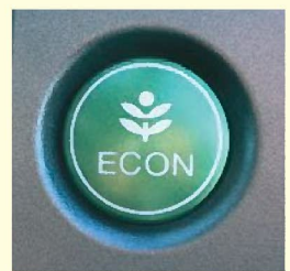
エコドライブスイッチの例

②エコドライブスイッチ ※ をONにしましょう。車の制御が変わって、ゆっくり加速しやすくなり、燃費が良くなります。