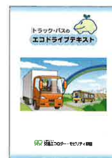
▲トラック・バスのエコドライブテキスト (200円/冊)