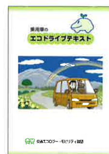
▲乗用車のエコドライブテキスト (200円/冊)