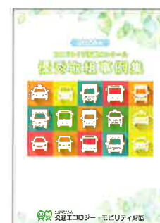
▲優秀取組事例集 (電子データのみで提供)