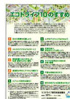
▲エコドライブ10のすすめチラシ・リーフレット (無料)