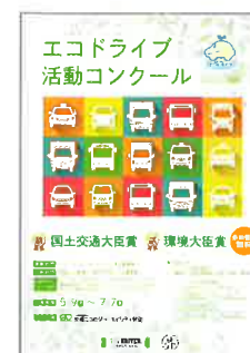
▲コンクールリーフレット (電子データのみで提供)