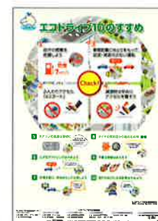
▲エコドライブ10のすすめポスター (無料)