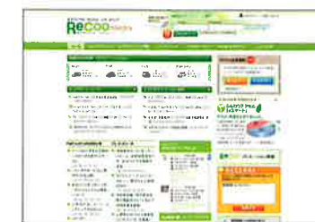
▲燃費管理支援サイトReCoo (無料/別途登録必要)