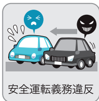
安全運転義務違反