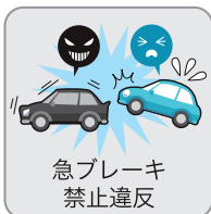
急ブレーキ 禁止違反