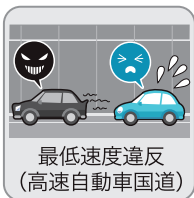
最低速度違反 (高速自動車国道)