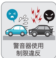
警音器使用 制限違反