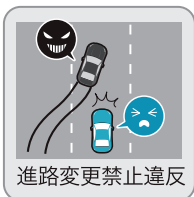
進路変更禁止違反