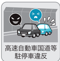
高速自動車国道等 駐停車違反