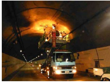
トンネル設備交換